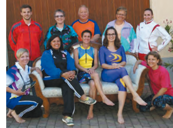
&gt; © 2018 OK Turnshow 2019

Das Ferienpass-Team und die Kursleiter freuen sich auf spannende Frühlingferien mit vielen motivierten Kindern.