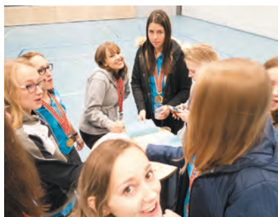
&gt; © 2018 Patrick Gasteli