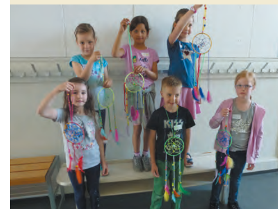
&gt; © 2018 Regula Albisser