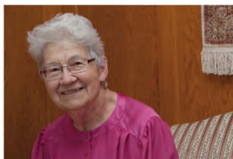
> © 2016 Claire Larcher