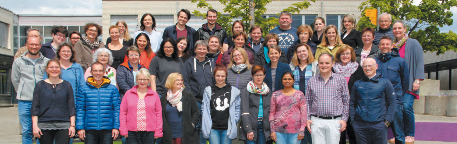
> Lehrpersonen © 2019 Christine Schwarz