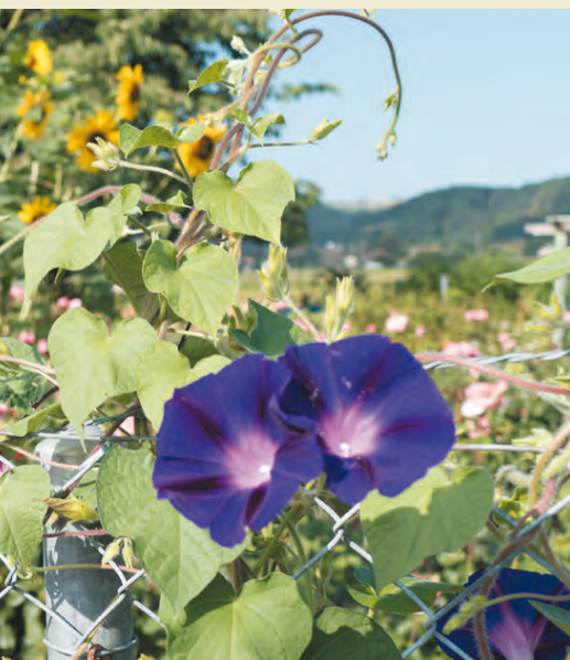
> Bugmann's Garten