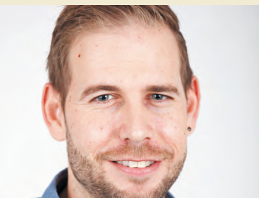
André Keller