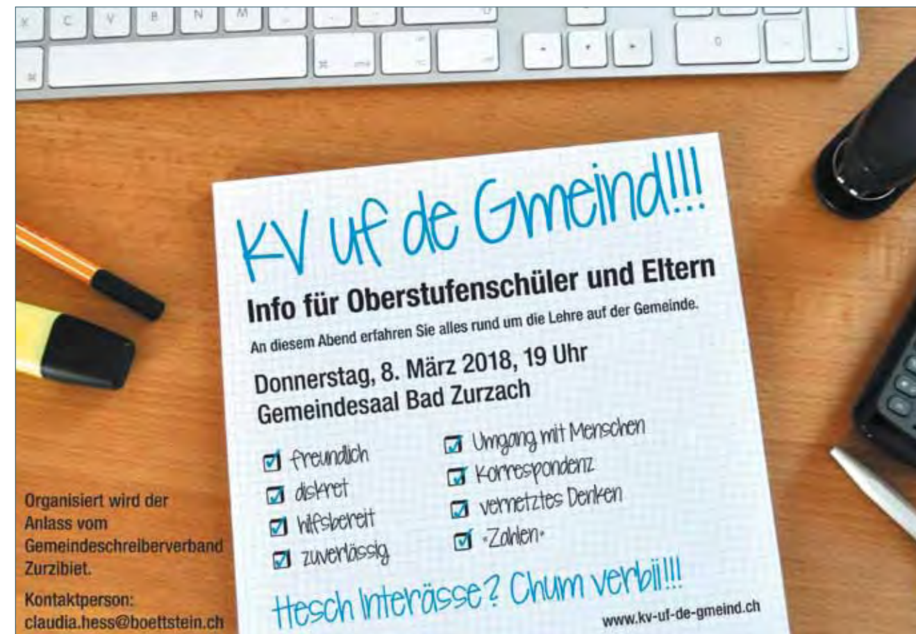
© 2018 Lehrlingsinfoabend "KV uf de Gmeind!!!"