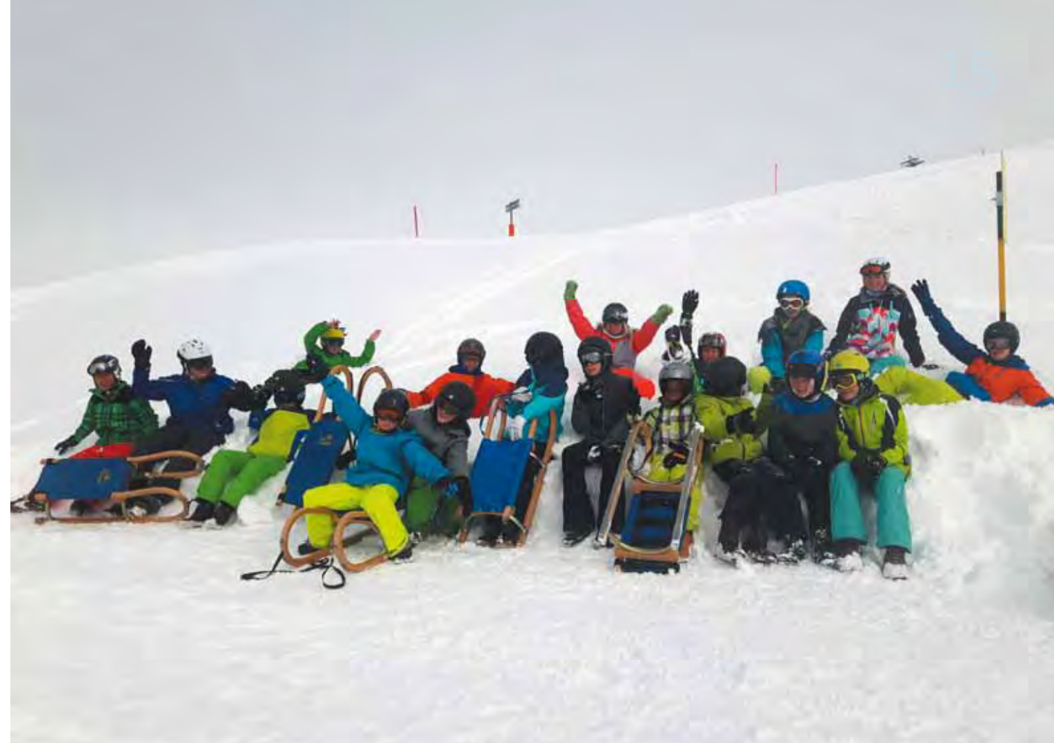
Schulen Böttstein