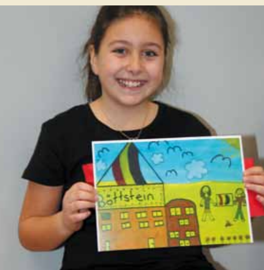
Schulen Böttstein